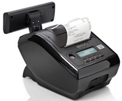
Design elegante e compatto, disponibile in due colori

Il design compatto, le funzionalità avanzate e un set di accessori dedicati consentono di integrare la stampante in qualunque tipologia di punto cassa