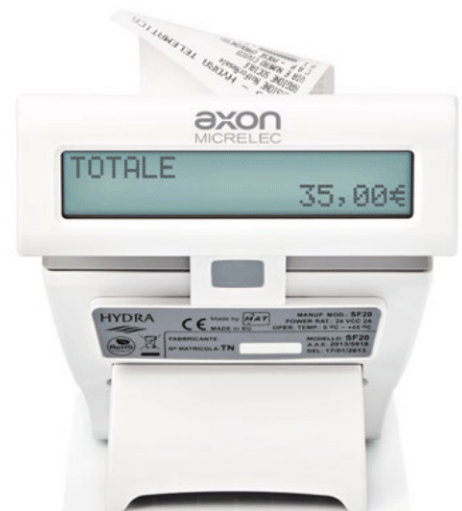
Doppio display ad alta luminosità integrato