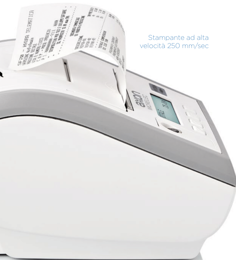
Stampante ad alta velocità 250 mm/sec