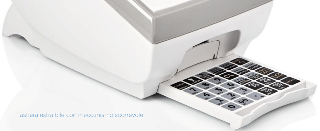
Tastiera estraibile con meccanismo scorrevole